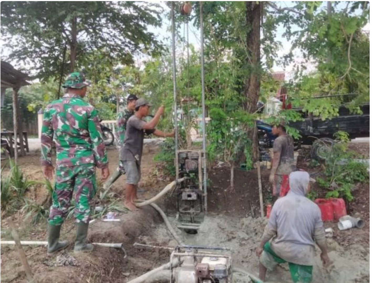
Foto: TNI Manunggal Air Bersih (TMAB) Program Unggulan Kepala Staf TNI Angkatan Darat (Kasad) Jenderal TNI Maruli Simanjuntak Menjadi Sasaran Tambahan Pada Pelaksanaan TMMD ke 122 tahun 2024 Kodim 0721/Blora di Desa Sidomulyo, Kecamatan Banjarejo, Kabupaten Blora Jawa Tengah, Rabau (2/10/2024).

BLORA - TNI Manunggal Air Bersih (TMAB) program unggulan Kepala Staf TNI Angkatan Darat (Kasad) Jenderal TNI Maruli Simanjuntak menjadi salah satu sasaran tambahan pada pelaksanaan program TMMD ke 122 tahun 2024 Kodim 0721/Blora yang berlangsung di Desa Sidomulyo, Kecamatan Banjarejo,