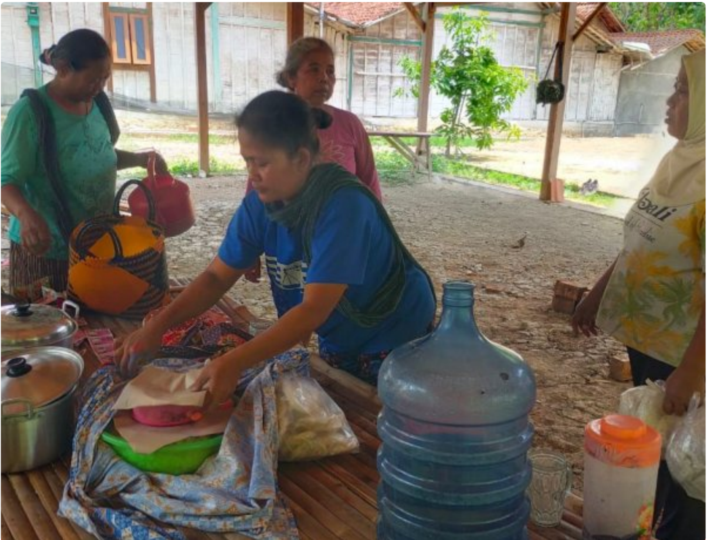
Foto: Saat Ibu-ibu Mengirimkan Makanan Untuk Anggota Satgas TMMD Reg 122 Kodim 0721/Blora, Jum'at (4/10/2024).

BLORA - Dalam semangat kebersamaan dan dukungan terhadap program TNI Manunggal Membangun Desa (TMMD), para ibu rumah tangga di Desa Sidomulyo menunjukkan antusiasme yang luar biasa dengan membawa makan siang dan minuman untuk Satgas TMMD Reguler ke-122 Kodim 0721/Blora yang tengah melaksanakan pengecoran pondasi jembatan. Jum'at (04/10/2024)